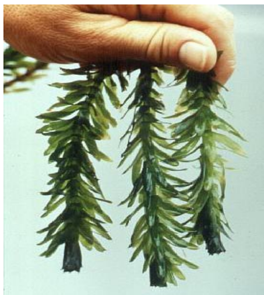
FIGURA 1. HÁBITO DE Egeria densa (luchecillo)

Una de las especies acuáticas vegetales fuertemente afectadas, que desapareció del lugar, fue el llamado "luchecillo" (Fig. 1 y 2), especie que los cisnes de cuello negro ( Cygnus melancoryphus Molina 1782) utilizaban como base de su alimentación. Esto provocó la muerte por inanición de cerca de 400 ejemplares de esta especie y la migración de un número cercano a los 3.000, a otros humedales de re-