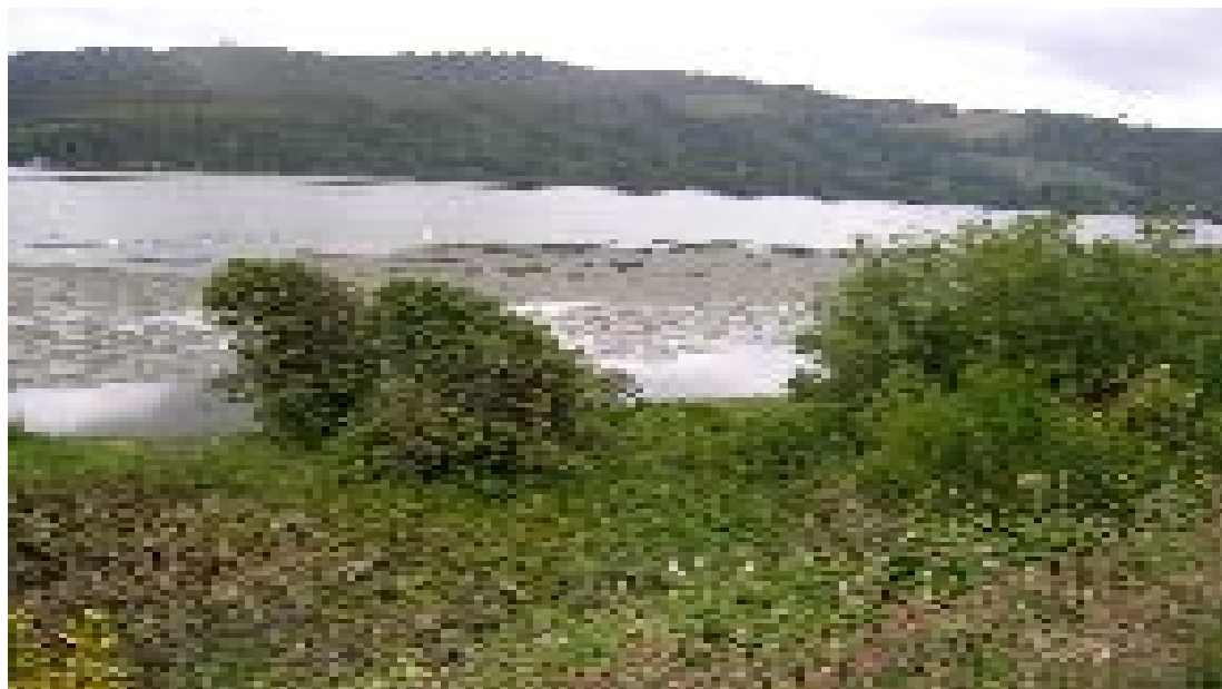
FIGURA 2. AMPLIA ZONA DE Egeria densa Y CISNES DE CUELLO NEGRO A ORILLAS DEL LAGO LANALHUE, VIII REGIÓN).

Debido a su gran capacidad de crecimiento vegetativo, por fragmentación de sus vástagos, es una hidrófita fuertemente invasora, capaz de desplazar a otras especies, como ocurre con E. potamogeton con la que comparte hábitat similares (Hauenstein 1981 4 , Peña & Salgado 1987 5 ). Se ramifica en forma irregular en zonas del tallo conocidas como “dobles nudos”, que son importantes en el almacena-